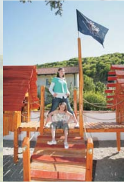
„WILDE - KERLE - SPIELPLATZ“

Damit Mama und Papa in Ruhe essen können, haben wir einen Spieleschrank mit verschiedenen Spielen zum Ausleihen, einen „WILDE - KERLE - SPIELPLATZ“ und ein tolles Spielhaus. Klar, dass die Kinder - Speisekarte von unseren „Junior - Chefinnen“ gestaltet wurde und zum Ausmalen gedacht ist! Für die Größeren gibt es Videospiele und Billard. Nach dem Essen geht es auf zu einer Runde Minigolf oder Pit - Pat.